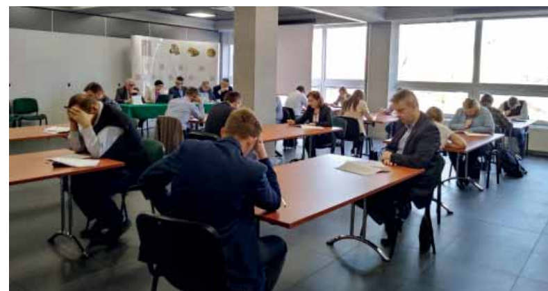
Informacje z Biura ŚIOIB